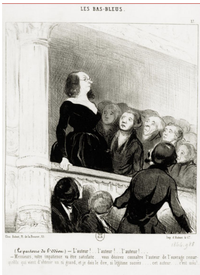
Lithographie publiée dans Le Charivari , le 17 mars 1844

“Fig., Bas-bleu , se dit d'une femme à prétentions littéraires, en souvenir d'un lord anglais à bas bleus qui fréquentait assidûment le salon de lady Montagu.”